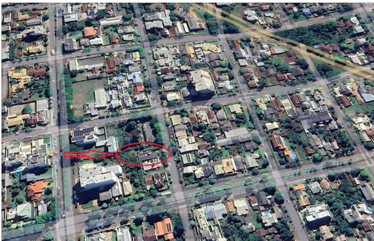
Figura 2: Localização do imóvel avaliado no Município de Medianeira