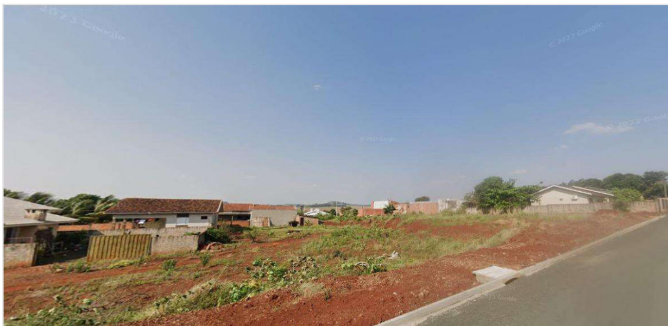
Data da última atualização: 19/08/2025