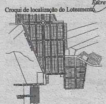
Cropa de localização do Loteamento.