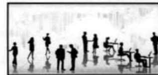
Câmara Municipal: Noções Básicas