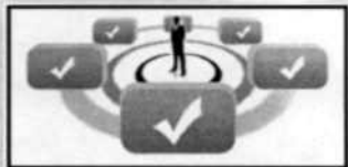
O Sistema de Controle Interno